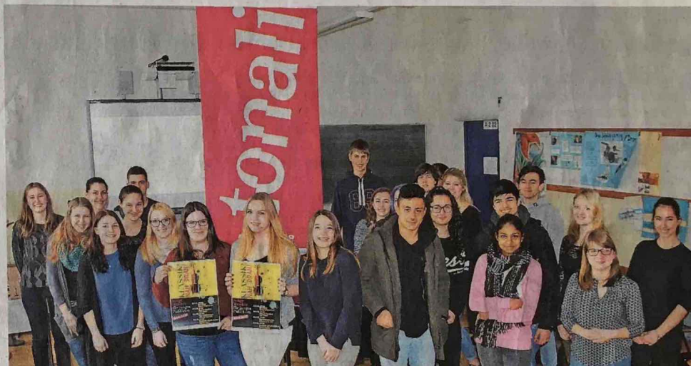
Die Teilnehmer trafen sich am Freitag zum ersten Mal im Musiksaal des Helmholtz-Gymnasiums.

Partner bei dem Projekt ist der Tonal-Wettbewerb, zu deren Tonalisten auch Ruppert gehört. Der Wettbewerb hat sich nach Aussage der jungen Geigerin sich zur Aufgabe gemacht, „junge Menschen für klassische Musik zu begeis-