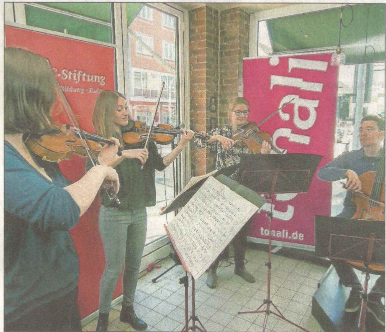
Das Quartett Querbeet spielte Beethoven leidenschaftlich und mit Ecken und Kanten, überzeugte gestern Morgen aber auch bei den modernen Stücken.

Das traditionelle Klezmer-Stück „Sher“ erntete viel Applaus. Übersprudelnde Vitalität und Lebensfreude klangen aus dieser Melodie, die in schnellen, prägnanten Rhythmen trotz des sehr scharf umrissenen Themas voll tänzerischen Schwunges war. Eine langsame Phase, die durch die markant schleppende, schwere Taktzeit Spannung in die Interpretation brachte, schlug um in einen sich